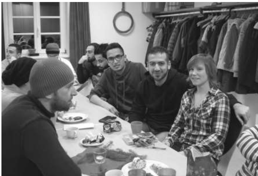
Neu- und Alt-Edertaler begegnen sich.