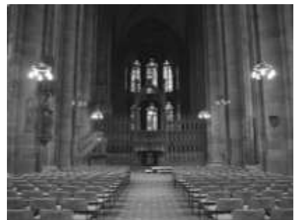
Der Innenraum der Elisabethkirche