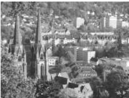
Blick vom Marburger Schloss auf die Elisabethkirche