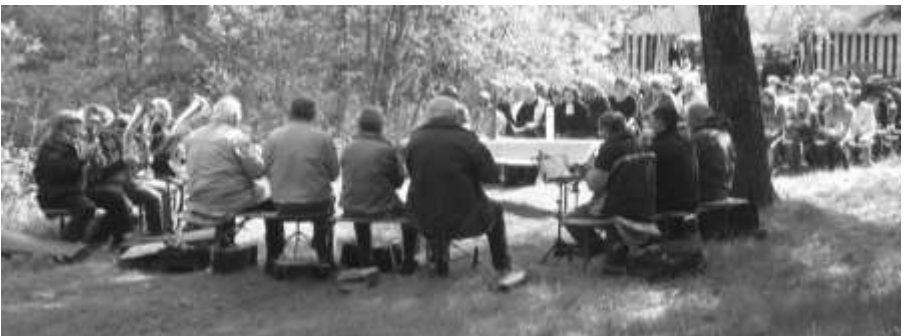
Waldfest auf dem Tannendriesch 2013, Gottesdienst

Ihre SG Wesetal und die Kirchengemeinden Kleinern, Gellershausen und Frebershausen.